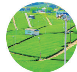
【Vườn trà trung tâm Yame】