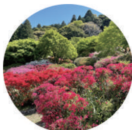
【Hoa đỗ quyên nở ở núi Kora】