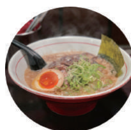
【Ramen xương heo(Tonkotsu)】