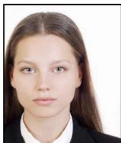
中心からずれている