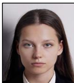
背景に影が写っている