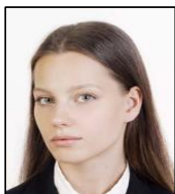
顔が横向きになっている